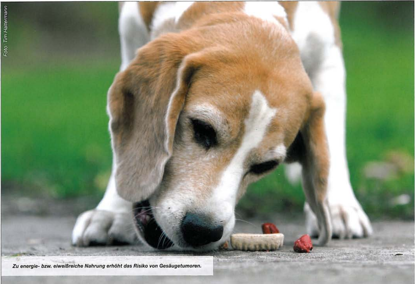
Zu energie- bzw. eiweißreiche Nahrung erhöht das Risiko von Gesäugetumoren.

Kategorisch abgelehnt werden muss, wenn nicht medizinische Gründe im Einzelfall dies unumgänglich machen, eine Kastration vor dem Abklingen der Pubertät.