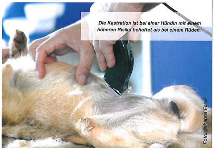
Die Kastration ist bei einer Hündin mit einem höheren Risiko behaftet als bei einem Rüden.

Was aber normalerweise nicht dazu gesagt wird, ist die Frage, wie viele Hündinnen denn überhaupt von Gesäugetumoren befallen werden. Je nachdem, welche Altersgruppe und welche Studie man