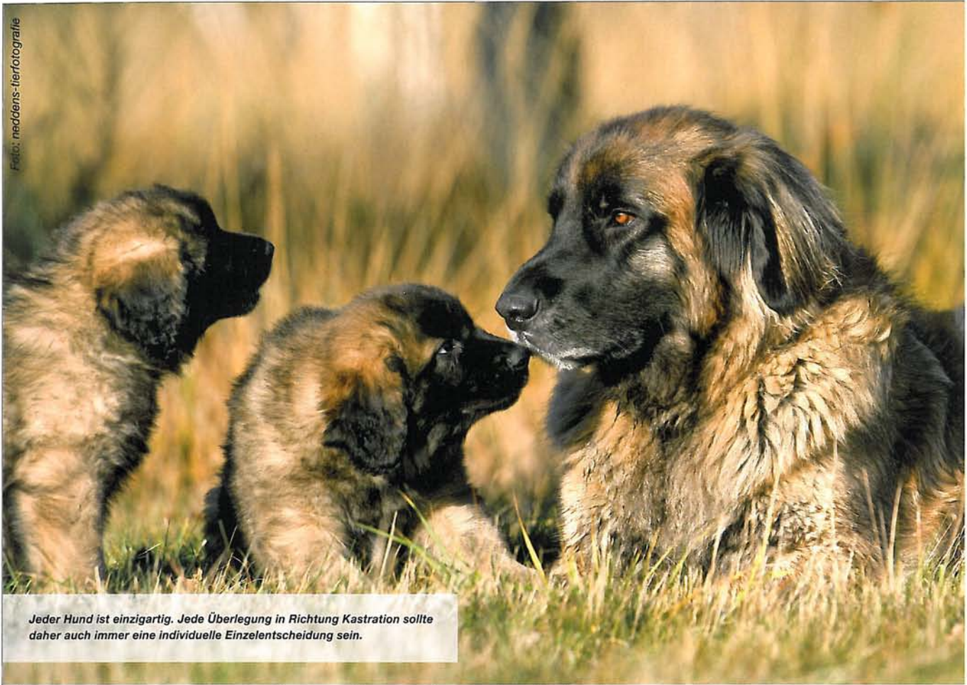
Jeder Hund ist einzigartig. Jede Überlegung in Richtung Kastration sollte daher auch immer eine individuelle Einzelentscheidung sein.

Kastration bedeutet Entfernung der Geschlechtsorgane, unabhängig davon, welches Geschlecht gerade unters Messer kommt. Die immer noch zum Teil geäußerte Ansicht, dass Kastration bei Rüden und Sterilisation bei Hündinnen vorgenommen würde, ist daher falsch. Sterilisation bedeutet „Fortpflanzungsunfähigmachung“ durch Durchtrennung der ausleitenden Kanäle, also des Samenleiters beim Hund bzw. des Eileiters und zum Teil auch der Gebärmutter bei der Hündin.