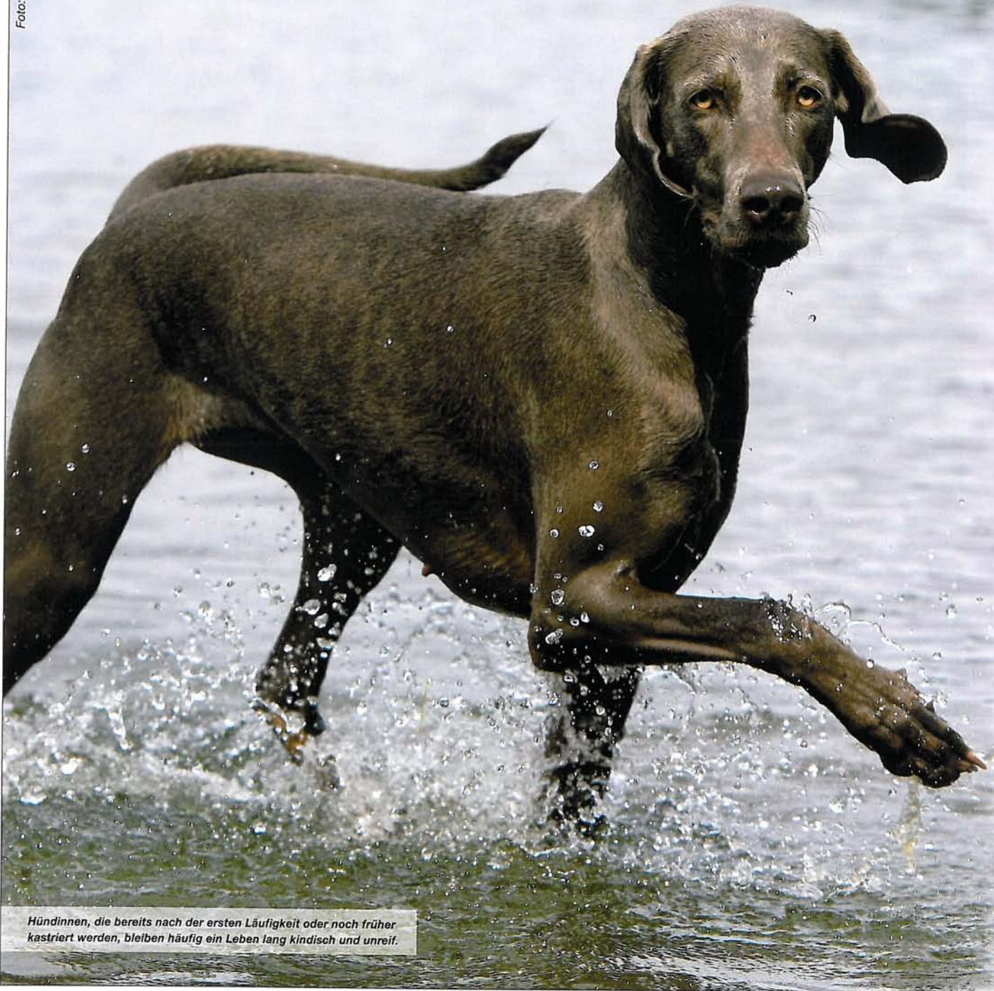
Hündinnen, die bereits nach der ersten Läufigkeit oder noch früher kastriert werden, bleiben häufig ein Leben lang kindisch und unreif.